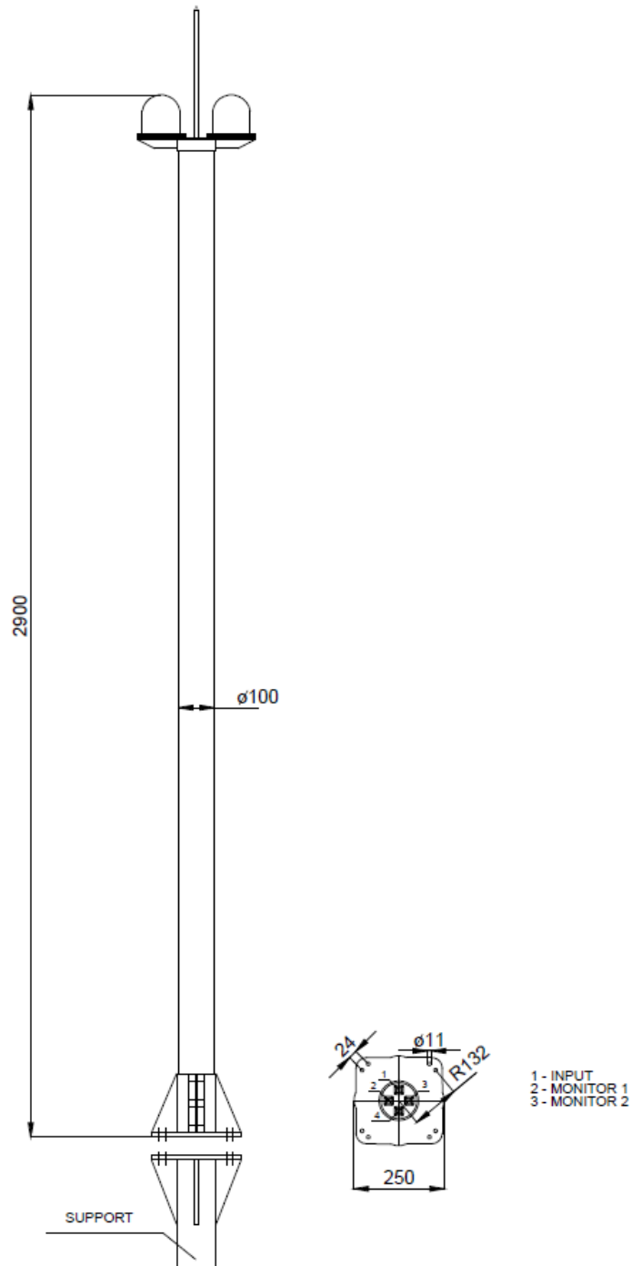
Wymiary anteny ATC S08H